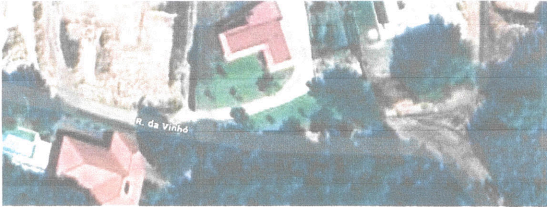
Foto 2. Troço da Rua da Vinhó a ser pavimentado

que se encontra com piso térreo e que no inverno o piso fica irregular e alagado.