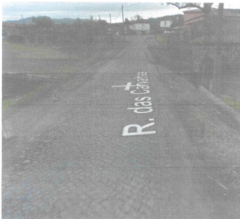
Foto 1. Rua das Carvalhas, zona de intervenção