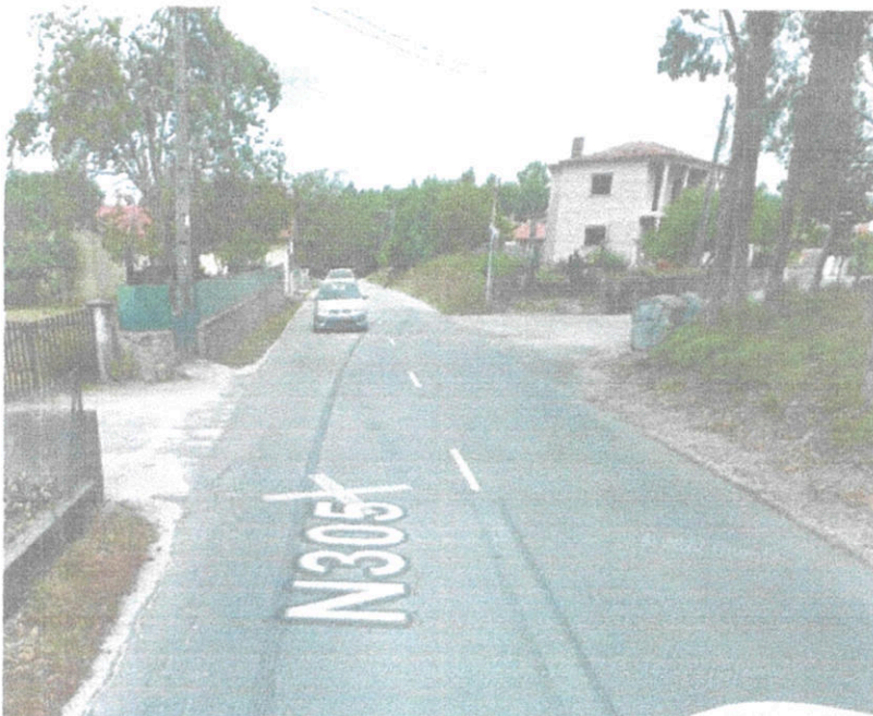
Foto 3. Rua da Ponte, local de implantação do abrigo